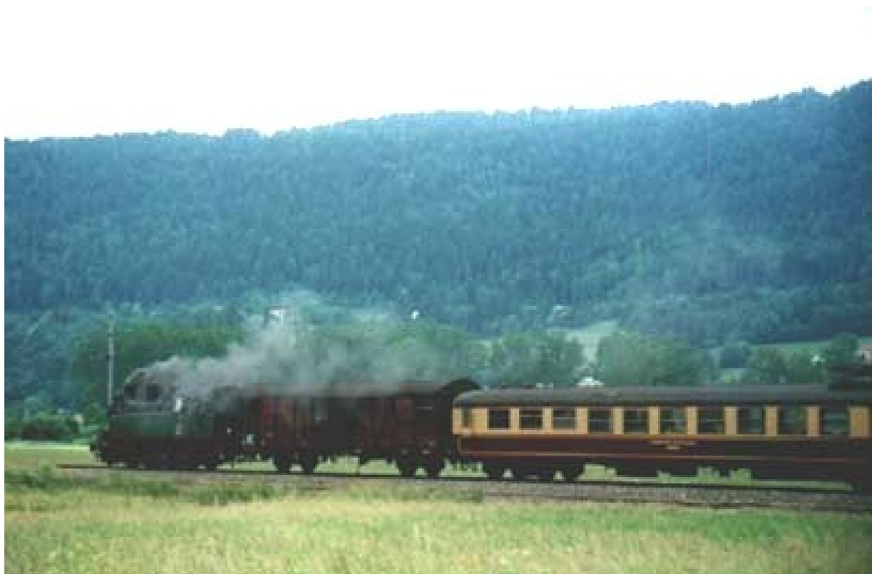
TKP 16 a 4 assi e la vettura ristorante

Il giorno dopo viaggio con automotrice Picasso e full immersion nella mostra; impossibile descrivere tutto: contrariamente alle aspettative, i diorami e i piccoli plastici mi hanno lasciato un loro segno, maggiore di quelli mastodontici. Credo che i più attraenti siano risultati i double-face o quelli semplici ma curati tipo Ferbach; in assoluto darei l'alloro al plastico dell'Associazione Olandese per idea, realizzazione e funzionamento in rapporto allo spazio contenuto; fuori dai soliti schemi un plastico old time con binari a doppio scartamento e una ragnatela di scambi costruiti a mano davanti alla quale ci si doveva togliere tanto di cappello. Presente anche un interessante plastico servito da automotrici diesel degli amici della Val d'Aosta. Sul Vapeur Val-de-Travers ritorneremo per descrivere il loro parco macchine, davvero imponente per una Associazione.