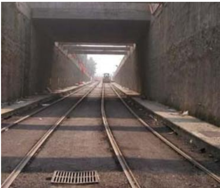
Pendenza del sottopasso Foto

Dall'altra parte della galleria ci sarà la fermata Mattei dove in un primo momento verrà ricavato un anello di ritorno per un capolinea provvisorio in modo da collegare subito almeno il teatro Arcimboldi, Università, stazione di Greco ed alcune importanti aziende con la M3, utilizzando linee già esistenti fino a piazzale Lagosta.