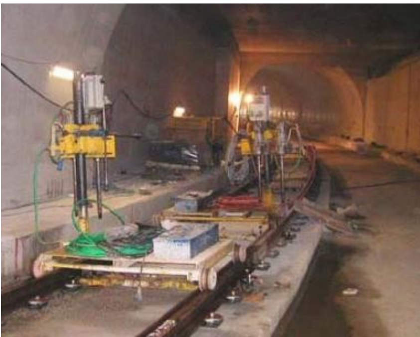
Carrelli con attrezzature di servizio.

Entro fine anno la posa sarà terminata completamente.