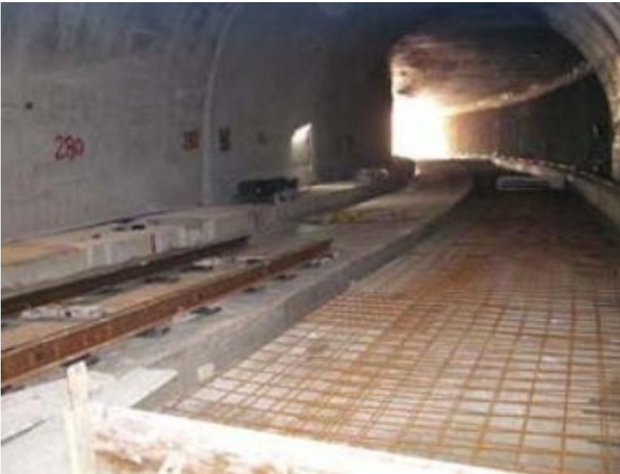
Uscita lato Mattei, in fase di ultimazione con particolare della base di appoggio dei binari

transitabile anche ai mezzi gommati di assistenza.