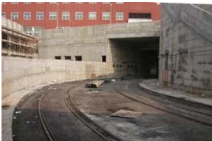
Ingresso galleria e sottostazione elettrica vista dalla fermata Precotto. Notare la terza rotaia sul lato interno della curva che, in caso di svio, garantisce una seconda presa del bordino.

Il percorso del progetto preliminare parte da Cascina Gobba (interscambio con M2) e giunge a Certosa FS passando per Precotto, Greco Pirelli, Ospedale Maggiore, stazione di Bovina FN ed area Politecnico, tutti grossi bacini di utenza e con interscambio -come detto- anche con la M3.