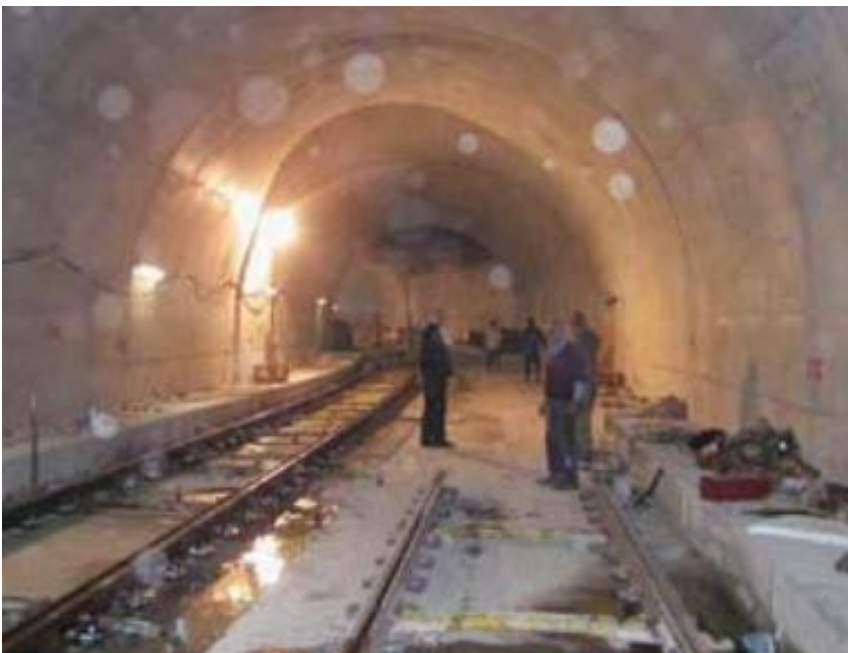
Interno galleria.

La visita tecnica è iniziata dove la linea entra in trincea, con pendenza del 4%, per sottopassare poi in galleria il fascio binari di Greco; alla base della trincea è prevista la fermata Biccocca Nord per servire il Teatro e la vicina Università degli Studi. Si entra poi in galleria (oltre 500 metri) scavata prima a cielo aperto e poi a foro cieco (sotto i binari FS) e nuovamente a cielo aperto ma con una soletta di cemento a protezione di una zona non coperta da binari ferroviari, ma che potrebbe essere utilizzata dalla FS in futuro.