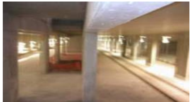
Marciapiedi ad isola dopo la biforcazione.

Sono previsti collegamenti sulla direttrice di v.le Molise, di v.le. Umbria e verso via Carbonera su nuova viabilità. E' prevista la predisposizione anche di una sede tranviaria protetta sulla direttrice Molise-Mugello.