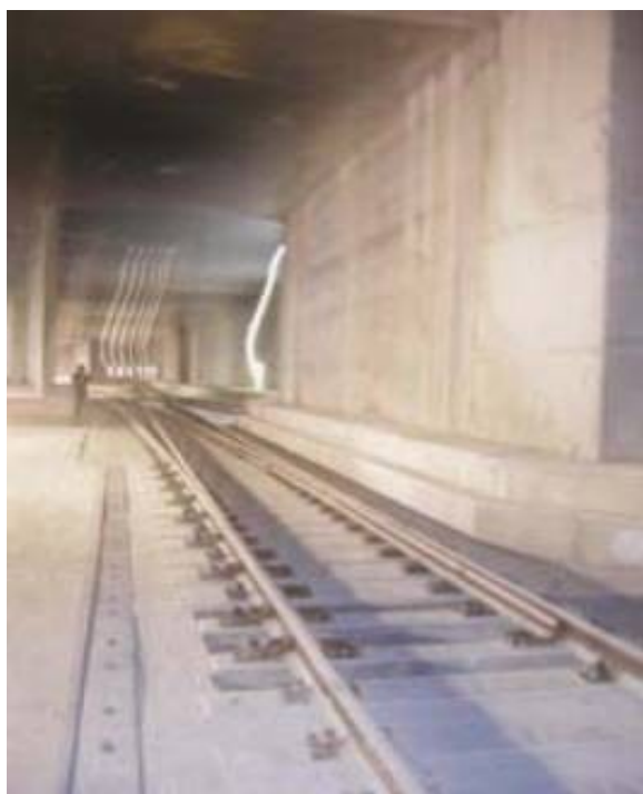
I lunghi aghi su cuscinetti.

Anche su questa tratta i metodi costruttivi sono stati diversi: sotto v.le. Piceno a foro cieco e sotto Vittoria a cielo aperto. Il tracciato si sviluppa per 1.047 m, in rettilineo sotto viale Piceno e quindi in curva per prendere la direttrice del vecchio scalo Vittoria; il vecchio sottopasso di v.le. Molise è stato interrato ed ora si transita in superficie mentre la vecchia sede ferroviaria dal cielo aperto è stata trasferita nel sottosuolo: così cambia anche l'aspetto della compagine cittadina.