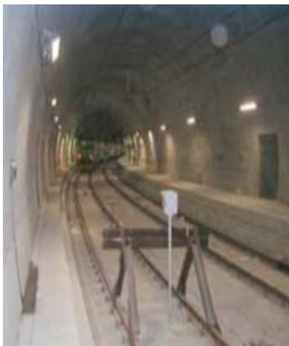
Asta di manovra di Dateo.

La stazione Vittoria sarà centro d'interscambio con le linee 90-91 (circonvallazione filoviaria) -92 e 93.