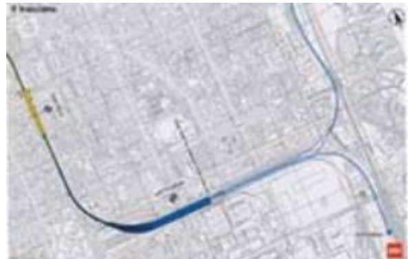
La tratta Dateo-Vittoria (documentazione MM)

La stazione del Passante è stata costruita sotto l'area della vecchia Stazione FS di P. Vittoria, stazione di testa un tempo usata per treni letti e auto al seguito, poi abbandonata e ridotta quasi a un rudere per i soliti vandalismi.