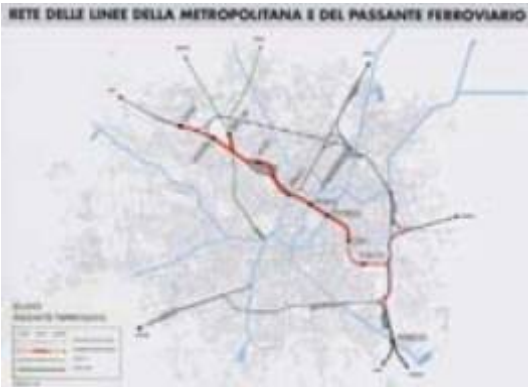
(documentazione MM )

Sabato 14 dicembre un nucleo del Gruppo Italo Briano si è unito agli appassionati dell' ACT per la visita al cantiere di Porta Vittoria, ultima stazione del Passante ferroviario milanese di competenza della MM spa (fine tratta urbana pgr. 3728,430). Oltre tale stazione infatti i lavori saranno eseguiti dalle FS e i due rami uscenti verranno collegati con la stazione FS di Rogoredo e col Bivio Lambro (linea per Treviglio).