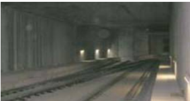
Prima dell'immissione in linea è visibile il tronchino di salvamento.

Il primo livello interrato comprenderà atrio e servizi collaterali, mentre il secondo accoglie le banchine ad isola e i 4 binari: due per Rogoredo e due per Pioltello in quanto gli scambi sono ubicati nella tratta urbana.