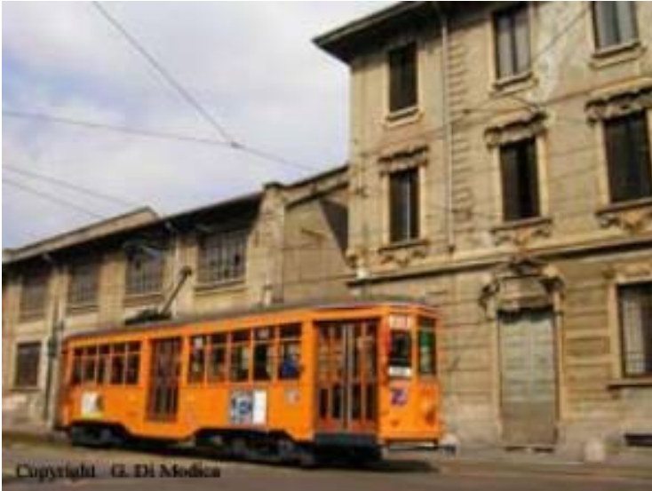
La '28 davanti allo storico palazzo C&T.

Domenica 28 marzo 2004 il Gruppo Italo Briano ha partecipato al giro dell'ACT- “Gli Amici del Tram” con la vettura tranviaria n° 1504 (consegnata dalle Officine Carminati e Toselli proprio nel marzo 1928) e che quindi veniva a compiere la veneranda età di 75 anni con all'attivo quasi 5.000.000 di Km percorsi per le strade di Milano.