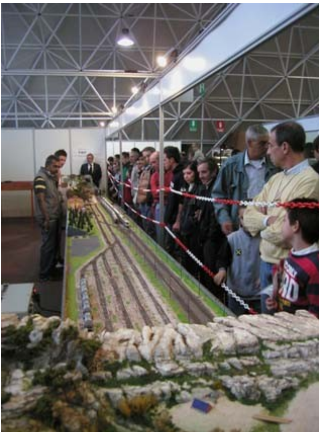
Affollamento di visitatori davanti al plastico.

Come sempre il nostro stand era ubicato nel padiglione centrale C e ben visibile da tutti i corridoi longitudinali.