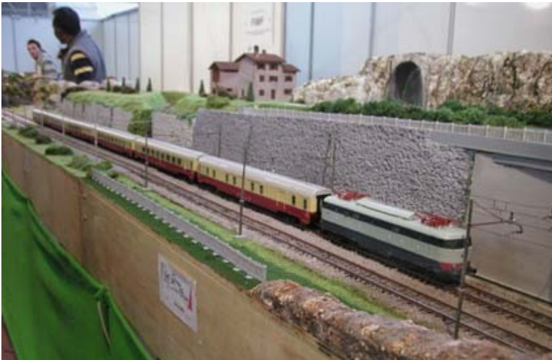
Un E 444 traina agilmente un lungo treno di carrozze TEE.